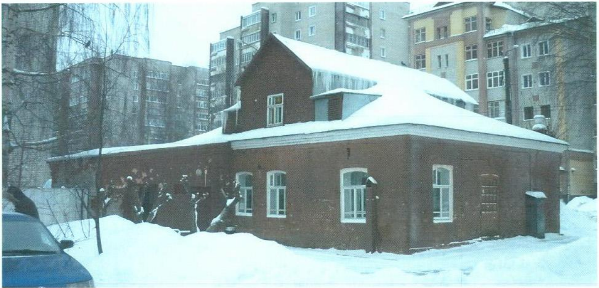
Фото 2. «Дом, в котором в 1881 – 1894 гг. жил писатель Грин Александр Степанович», г. Киров, ул. Володарского, д. 44. Вид с северо-востока. Дата – 14.01.2016.