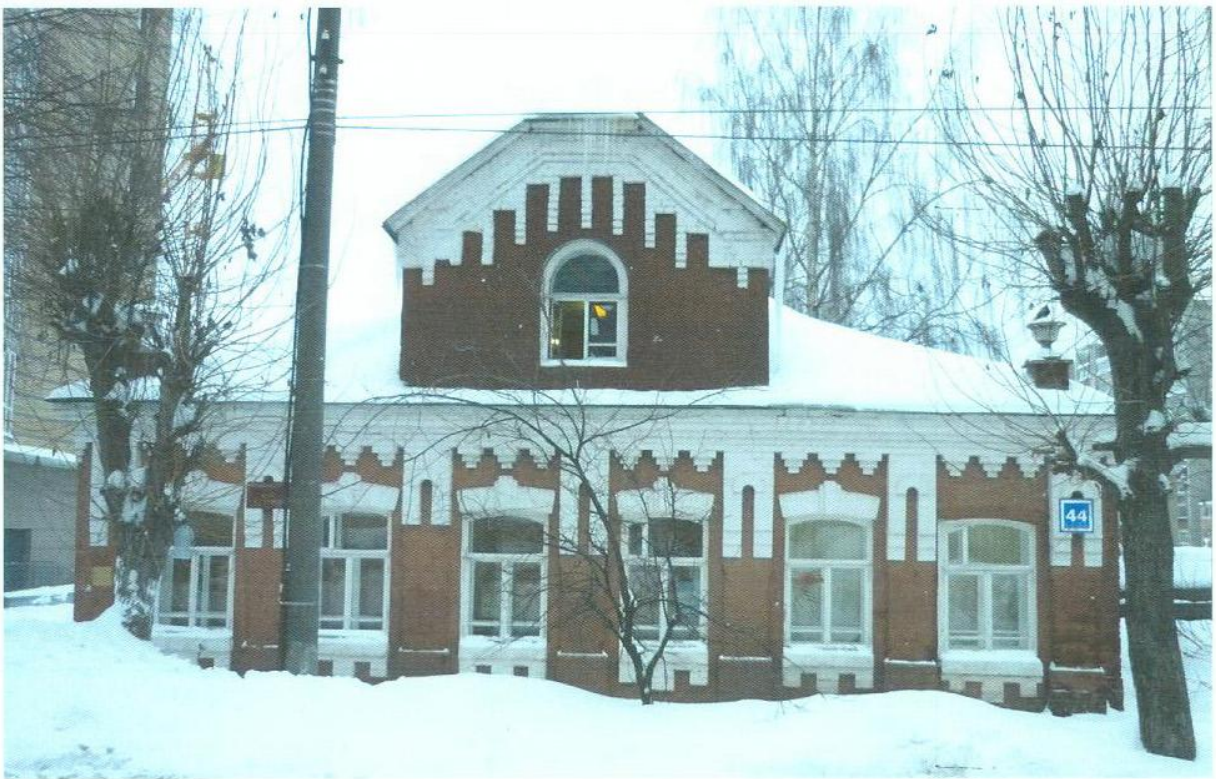
Фото 1. «Дом, в котором в 1881 – 1894 гг. жил писатель Грин Александр Степанович», г. Киров, ул. Володарского, д. 44. Вид на западный фасад. Дата – 14.01.2016.