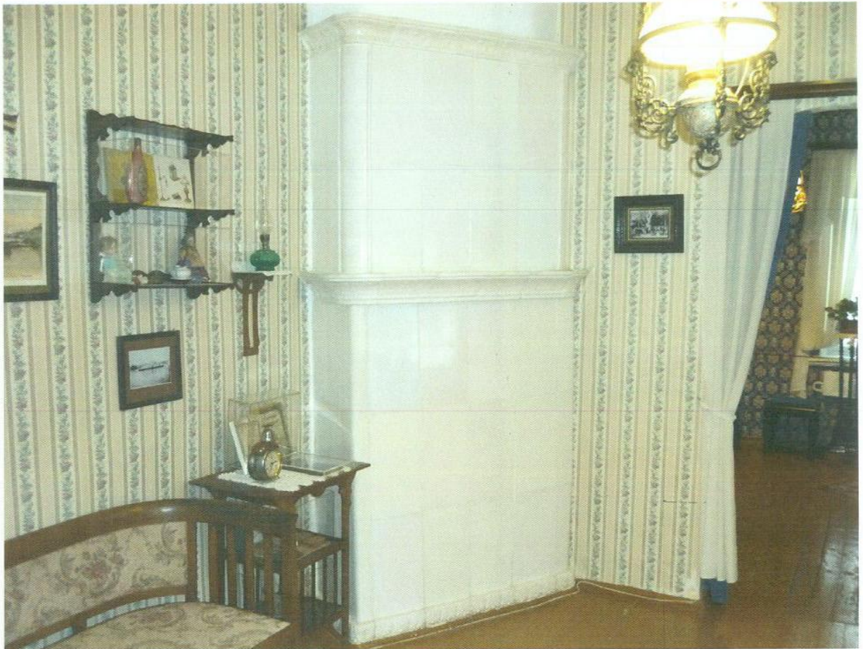
Фото 8. «Дом, в котором в 1881 – 1894 гг. жил писатель Грин Александр Степанович», г. Киров, ул. Володарского, д. 44. Интерьер. Дата – 14.01.2016.