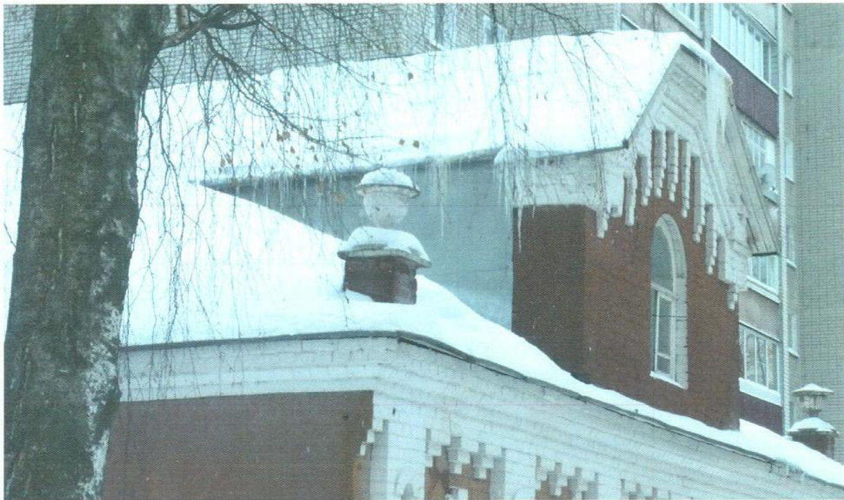
Фото 4. «Дом, в котором в 1881 – 1894 гг. жил писатель Грин Александр Степанович», г. Киров, ул. Володарского, д. 44. Фрагмент западного фасада. Дата – 14.01.2016.