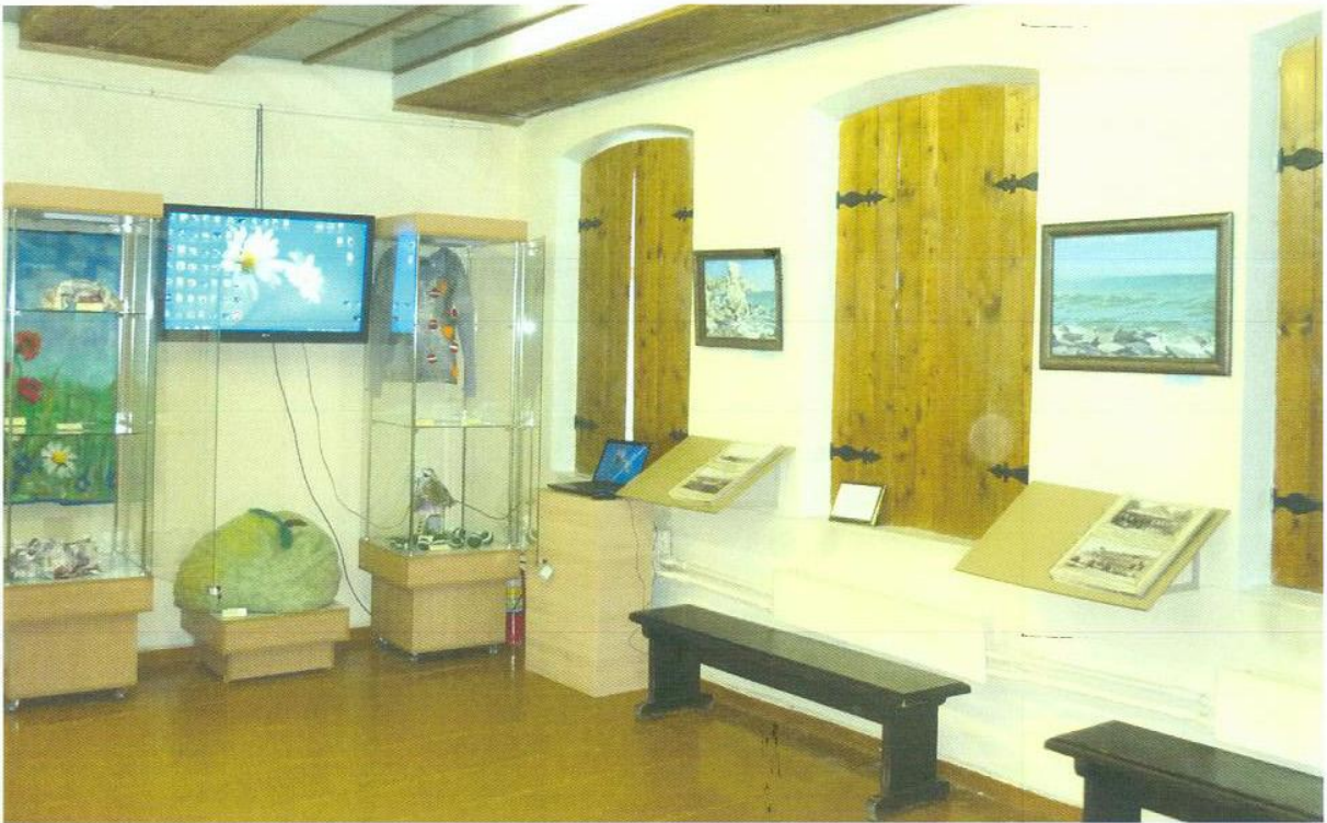
Фото 6. «Дом, в котором в 1881 – 1894 гг. жил писатель Грин Александр Степанович», г. Киров, ул. Володарского, д. 44. Интерьер. Дата – 14.01.2016.