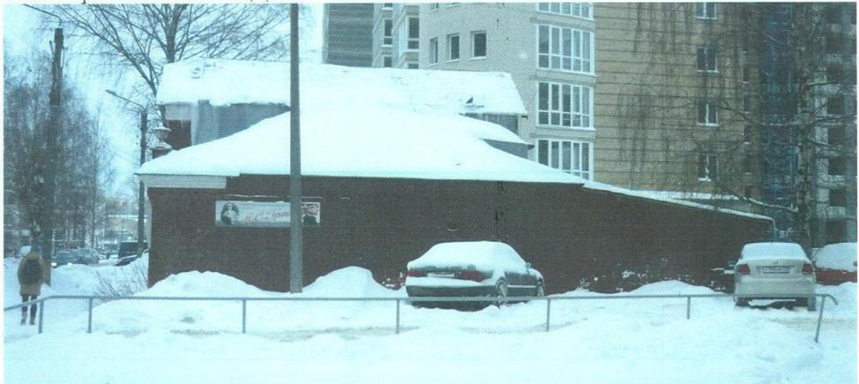
Фото 3. «Дом, в котором в 1881 – 1894 гг. жил писатель Грин Александр Степанович», г. Киров, ул. Володарского, д. 44. Вид на южный фасад. Дата – 14.01.2016.