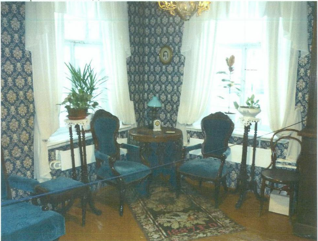
Фото 7. «Дом, в котором в 1881 – 1894 гг. жил писатель Грин Александр Степанович», г. Киров, ул. Володарского, д. 44. Интерьер. Дата – 14.01.2016.