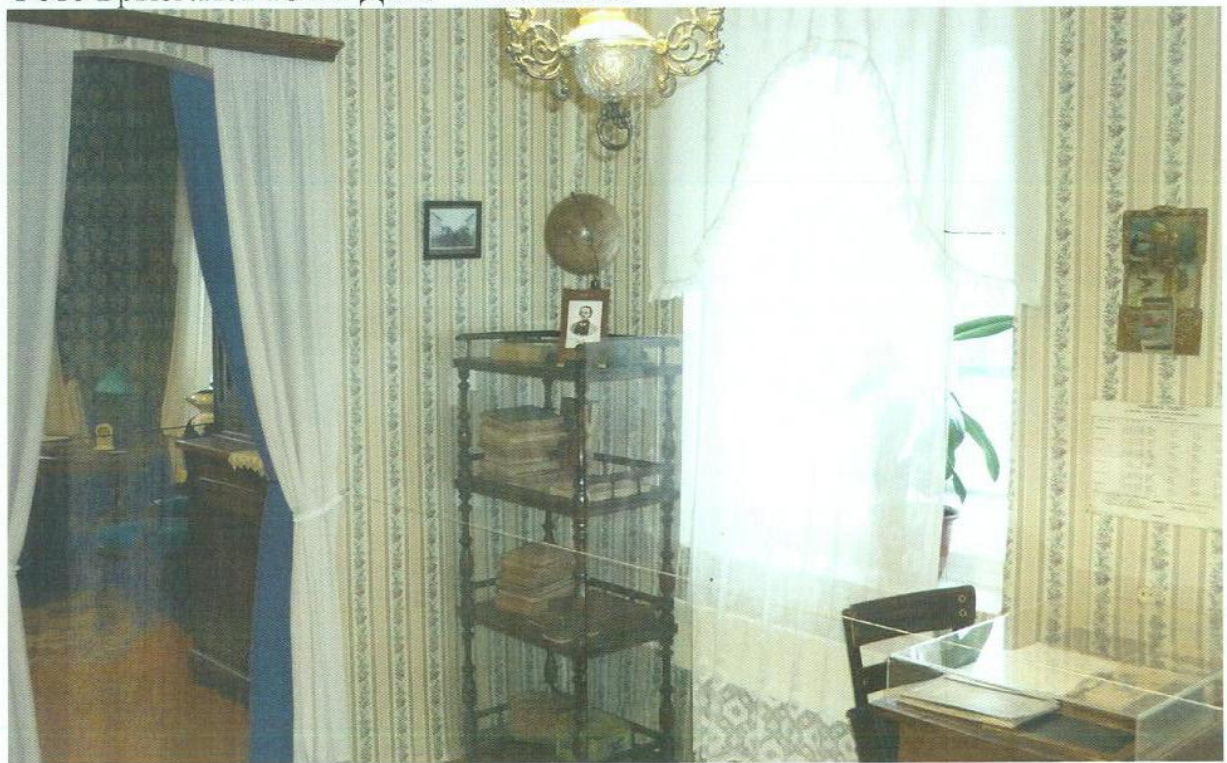
Фото 9. «Дом, в котором в 1881 – 1894 гг. жил писатель Грин Александр Степанович», г. Киров, ул. Володарского, д. 44. Интерьер. Дата – 14.01.2016.